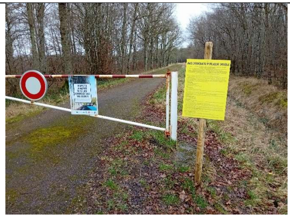
P2 – Accès à la digue du barrage de Grand Rue depuis Breteau