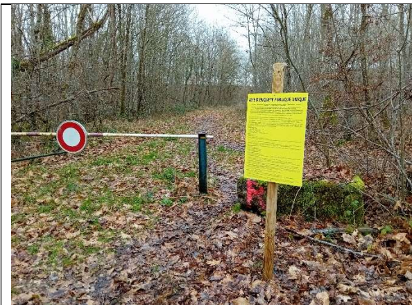
P1 – Accès à la digue du barrage de Grand Rue depuis le hameau de St Aubin commune d’Ouzouer-sur-Trézée