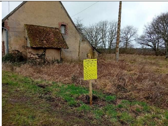
P3 – Affichage à la maison du barragiste de Grand Rue